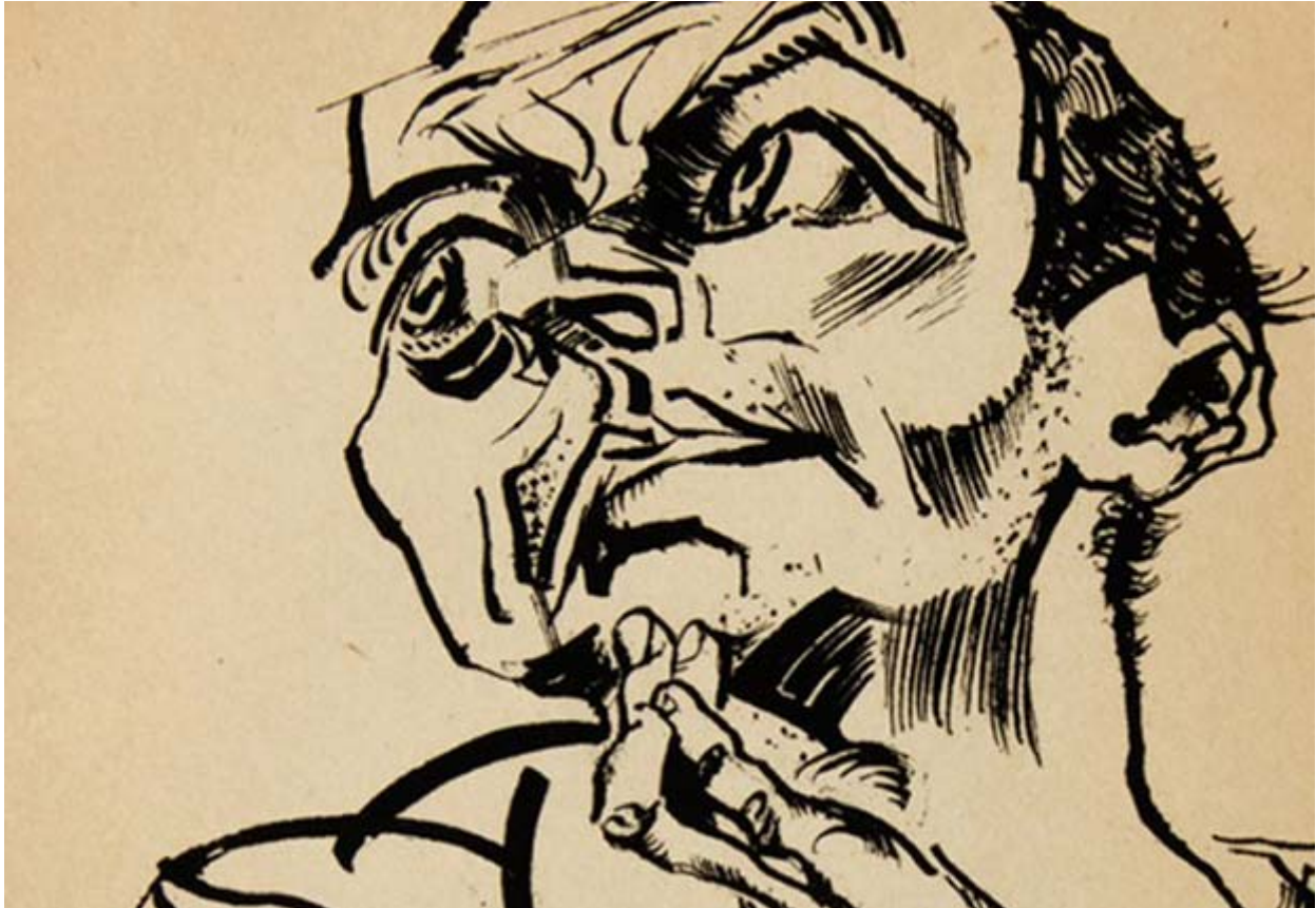
Ludwig Meidner „Im Nacken das Sternemeer“. Blatt 2, Lithographie, 1916 (Ausschnitt)