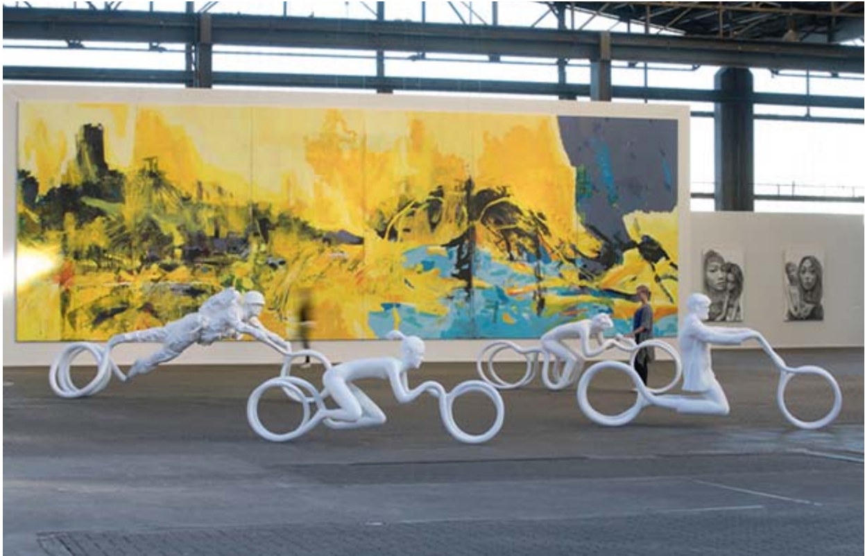
„Apocalyptic Rider“ von Michal Gabriel vor Wolfgang Gramms „Get Together“