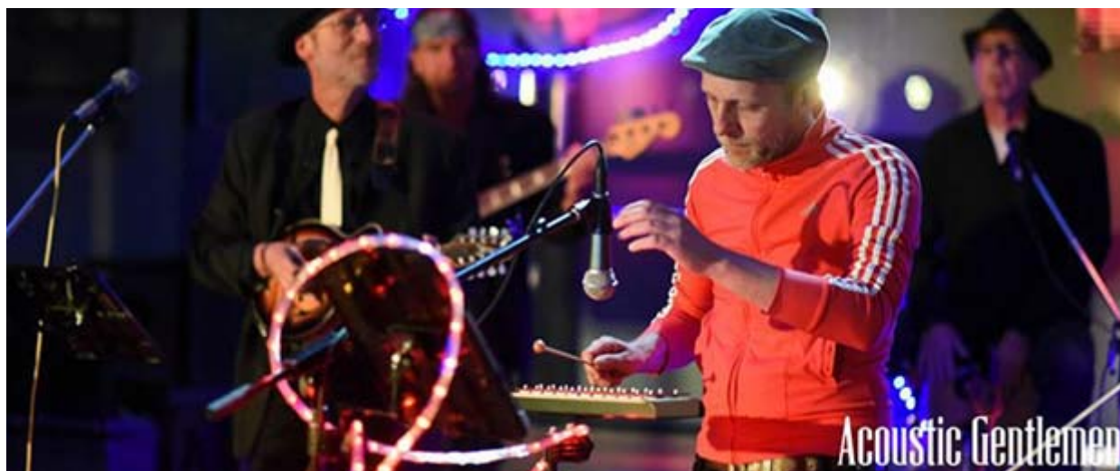
Open Air Party mit den Acoustic Gentlemen.