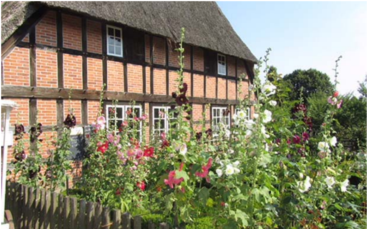
Stockrosen im Molfseer Bauerngarten.