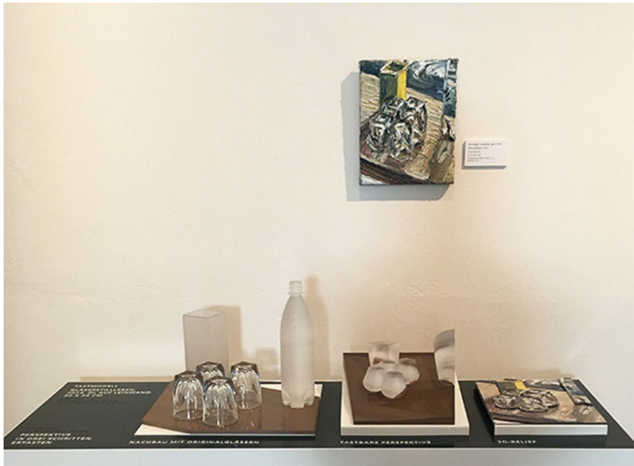
Taststation, um Perspektive zu begreifen.