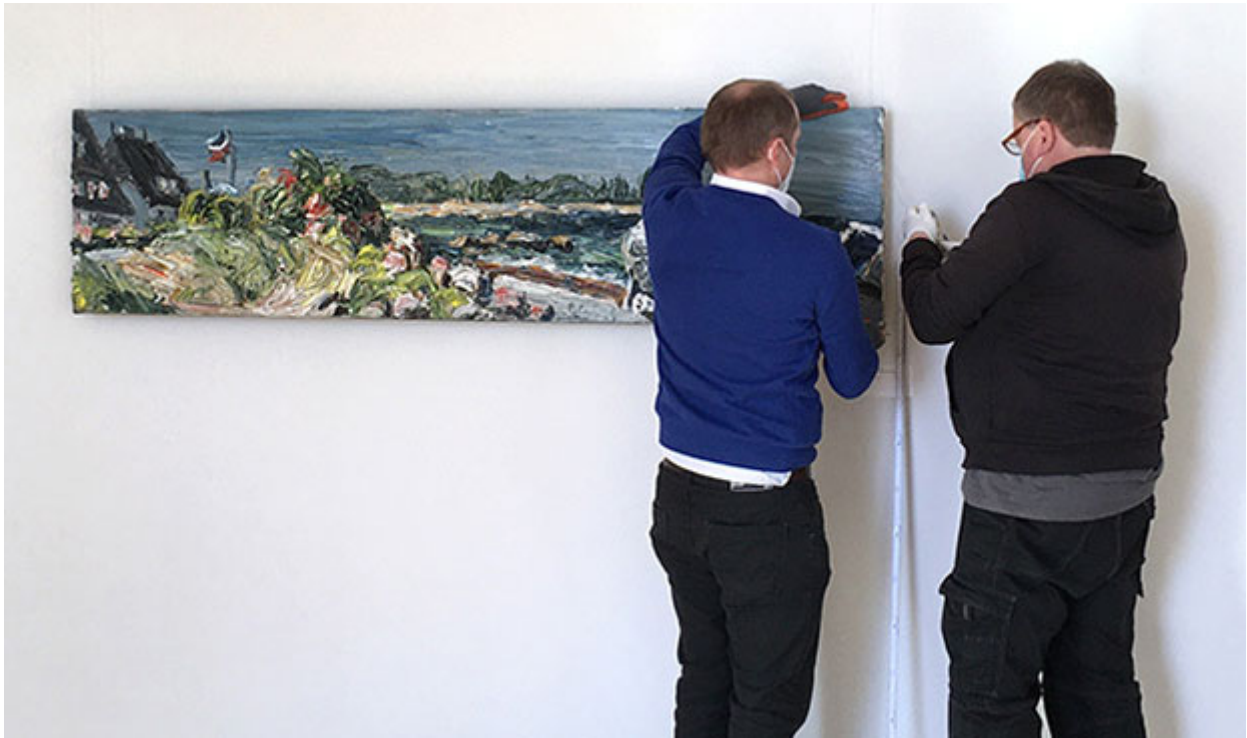
Maßarbeit, damit das Bild nicht schief hängt.

Das Gemälde entstand an einem strahlenden 18. Juni 2021 in Hohwacht an der Ostsee. Christopher Lehmpfuhl hat das extreme Querformat direkt am Strand, unterhalb des Hotels „Genueser Schiff“