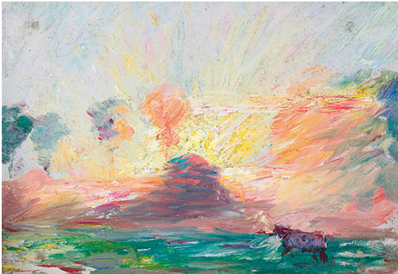
Hans Olde, Abendsonne in der Marsch, 1899, Ölskizze