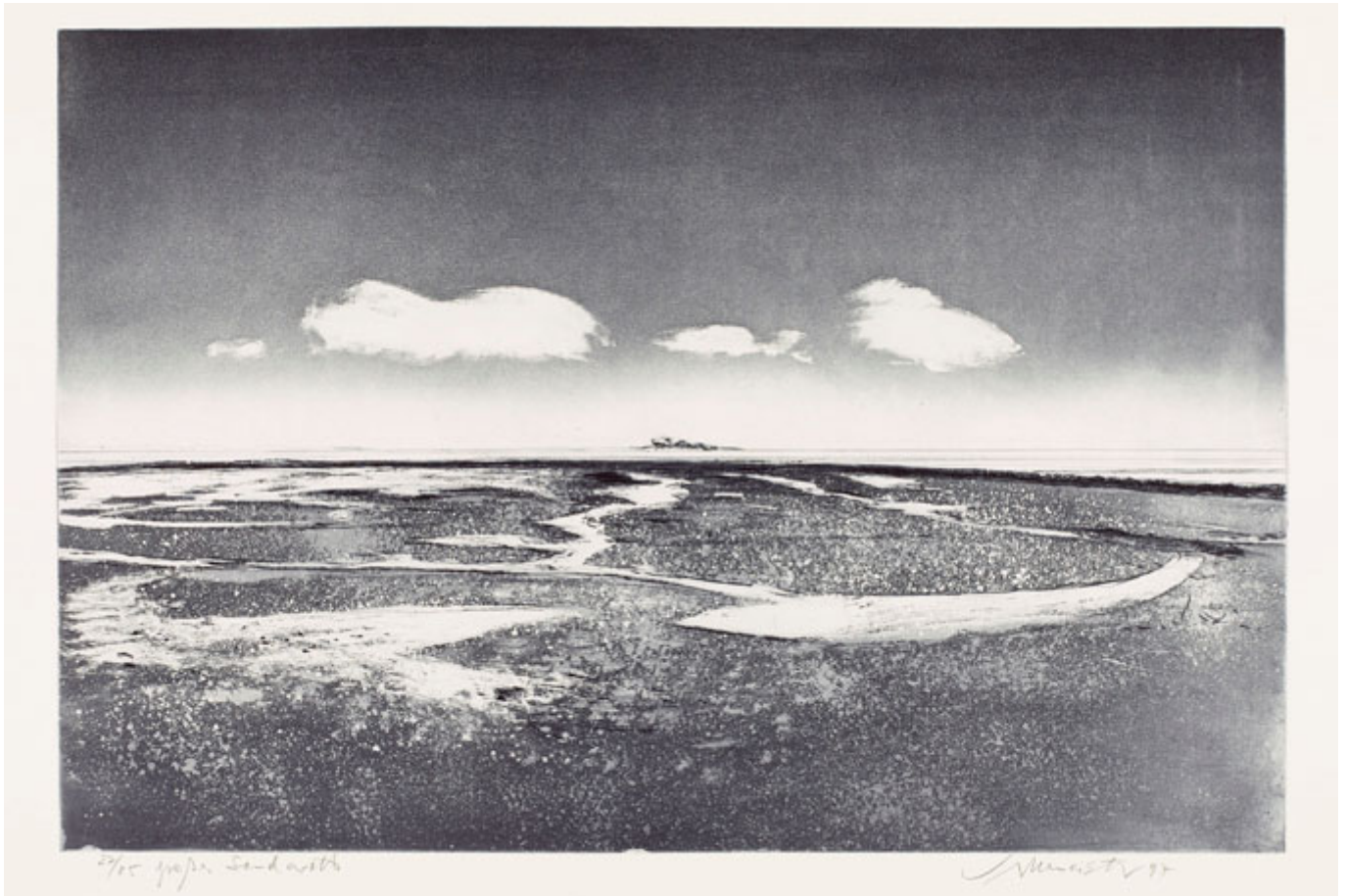
Wolfgang Werkmeister, Großes Sandwatt, 1997 © VG Bild-Kunst